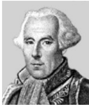
Jean-Baptiste Biot Felix Savart