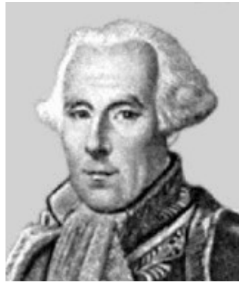
Jean-Baptiste Biot Felix Savart